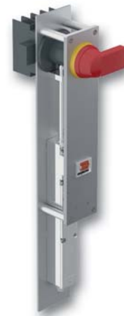
SAFEMASTER STS Power Interlocking ZRH01SLPR40